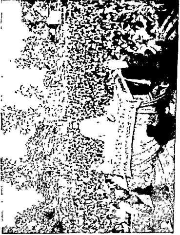
सोबोदेवरा (बिहार) जयप्रकाशजीच्या आश्रमालील जाहीर सना